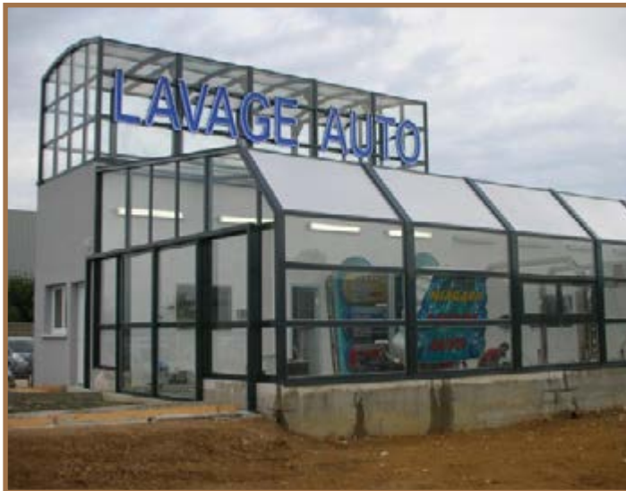
Station de lavage