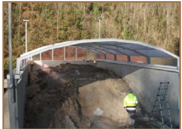
Bac a sel